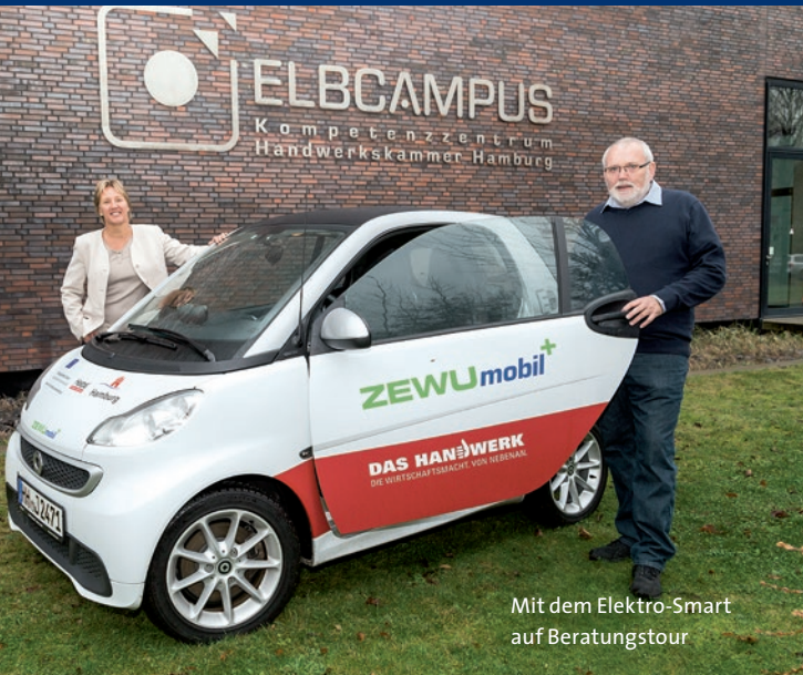
Mit dem Elektro-Smart auf Beratungstour